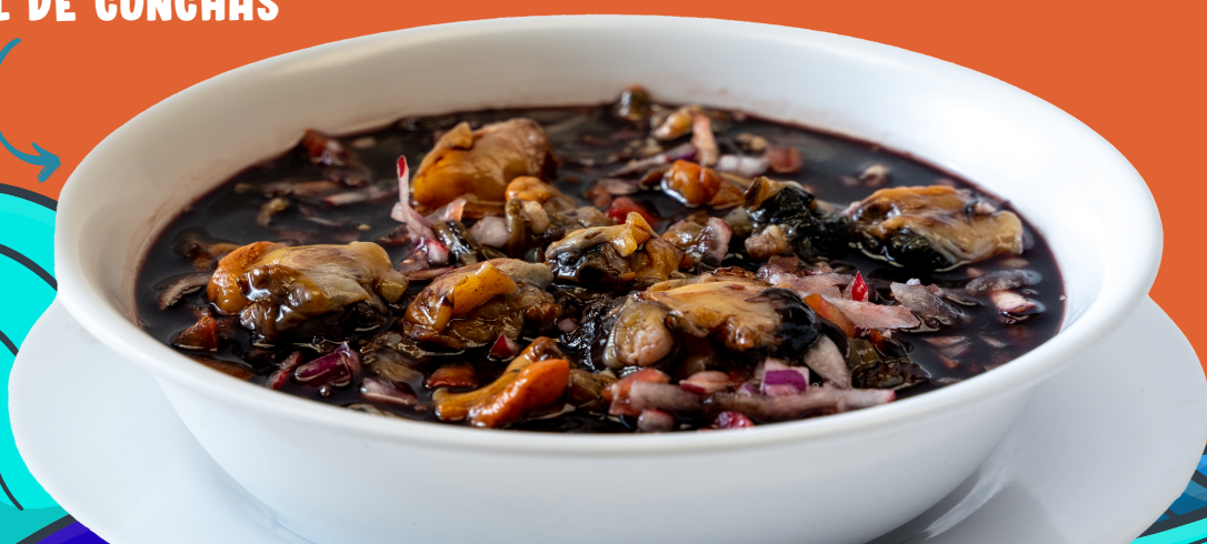
COCTEL DE CONCHAS