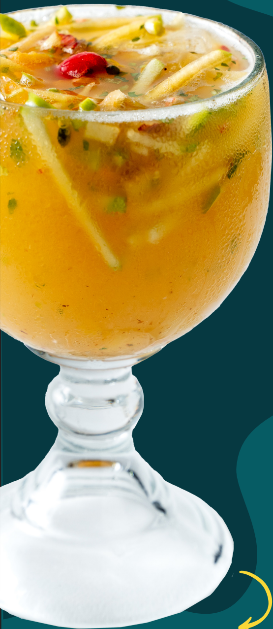
REFRESCO DE ENSALADA