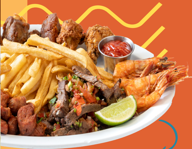
SUPERPLATO DE BOCAS